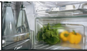
TABLE TOP CCTLS 542 WH